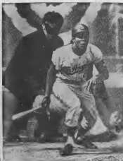
Riba e primer grafica John Roseboro, di e equipo Los Angeles, e receptor Howard of Yanquis y e árbitro Joe Paparella ta apereci mirando e bala cu cual Roseboro a bati un homerun. Riba e otro grafica Willie Davis, di Los Angeles, y e árbitro Tom Borman ta observa e batazo cu Davis a dal den direccion di Roger Maris.